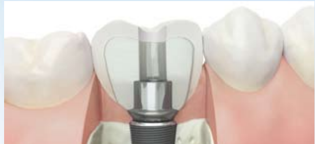
Herkömmliches angussfähiges Abutment