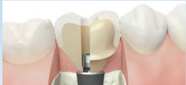
Atlantis™ patientenindividuelle CAD/CAM Crown Abutments

Weitere Informationen zu den Atlantis™ Abutments für zementierte und verschraubte Versorgung und deren Vorteile finden Sie unter www.atlantisabutment.de .